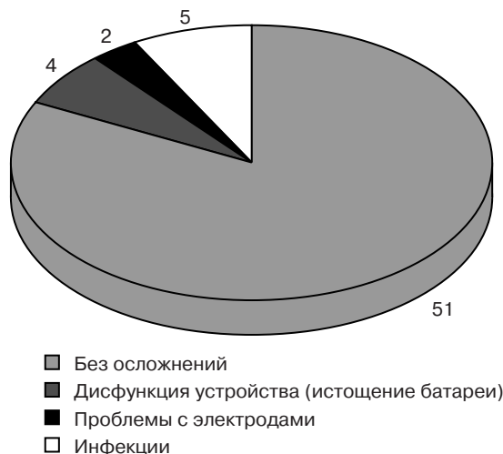
Рис. 2. Оценка пери- и постимплантационных осложнений при проведении хронической ресинхронизирующей терапии