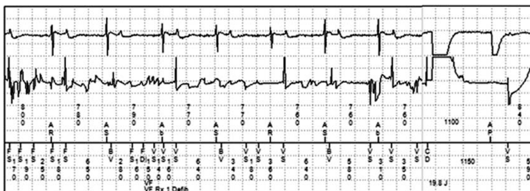
Рис. 1. После регистрации длительных эпизодов шумов на дефибриллирующем электроде имплантированный кардиовертер-дефибриллятор дискриминировал их как фибрилляцию желудочков и нанес разряд мощностью 20 Дж