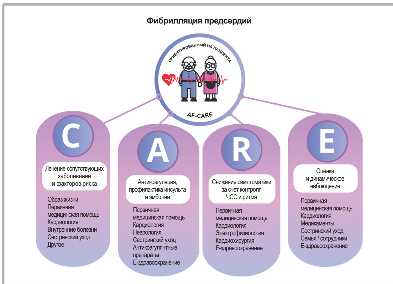
Рис. 1. Междисциплинарный подход в лечении ФП [10]

На сегодняшний день доказано, что катетерная абляция (КА) для стратегии контроля ритма у пациентов с ФП вместо медикаментозной уменьшает частоту возникновения пароксизмов, бремени ФП и тяжесть течения заболевания и улучшает качество жизни [6]. Однако влияние этой стратегии на продолжительность жизни до сих пор остается предметом споров. Тем не менее результаты недавно опубликованного рандомизированного клинического исследования CASTLE-AF [7] и ряда других ран-